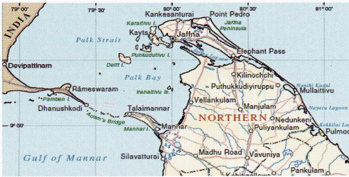
Map No. 4172 Rev. 2 UNITED NATIONS January 2007

1982 මුහුදු නීතිය පිළිබඳ එක්සත් ජාතීන් ගේ ප්‍රඥප්තිය (UNCLOS) ක්‍රියාත්මක වීමට බොහෝ කලකට පෙර පෝක් සමුද්‍ර සන්ධිය ඔස්සේ වූ මුහුදු සීමාව නිගමනය වූයේ සමාන දුර පදනම් කරගෙන ය. මේ ආකාරයෙන් ධීවර කලාපයන් බෙදා සලකුණු කරනු ලැබ තුබුණු ජාත්‍යන්තර මුහුදු සීමා රේඛාවට (IMBL) ඇතැම් අවස්ථාවන් හි දී දෙරටෙහි ම සිටි තුබුණේ කිලෝ මීටර 16 ක් තරම් වූ දුරක් පමණි.